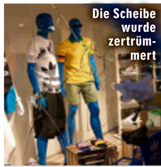
Die Scheibe wurde zertrümmert