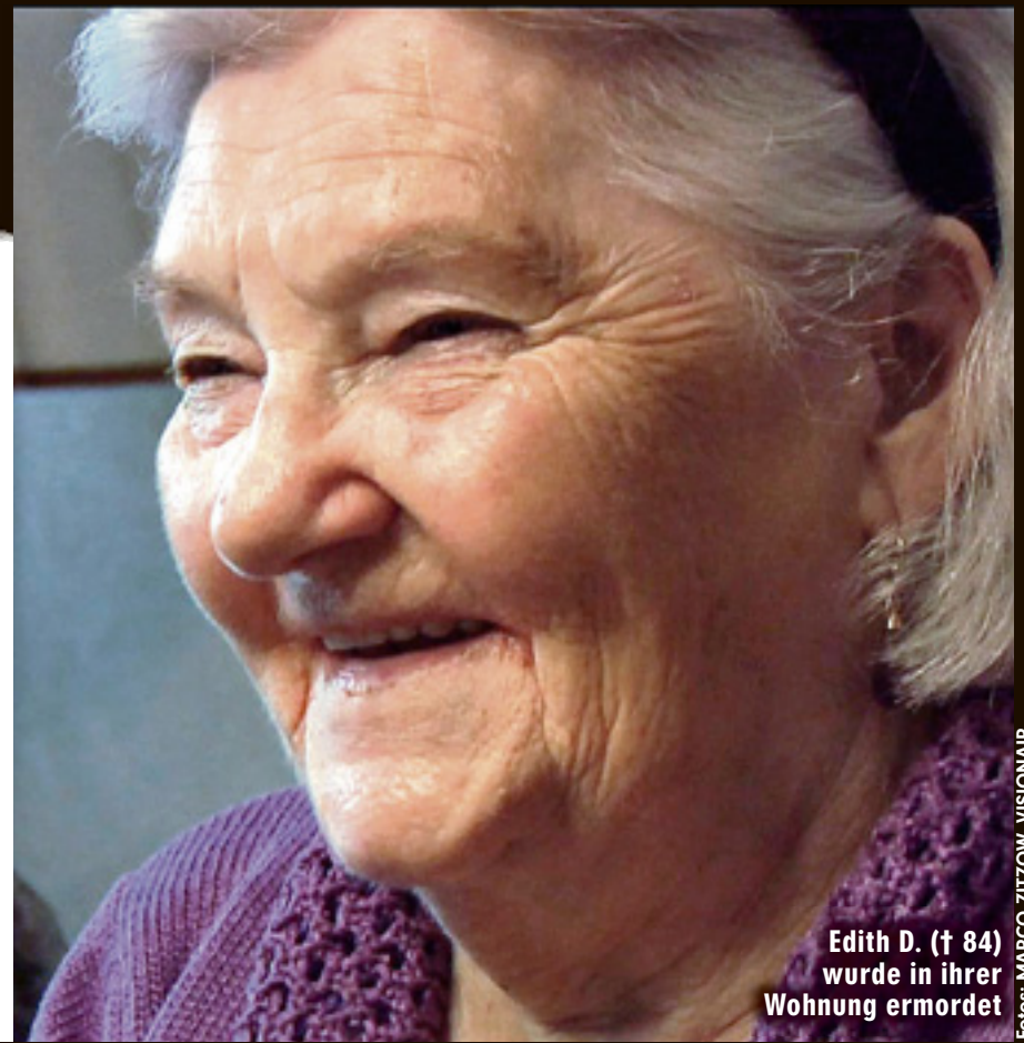
Edith D. († 84) wurde in ihrer Wohnung ermordet

Polizeisprecher Andreas Schöpfli: „Wir haben gute Bilder aus den Videoüberwachungskameras der Banken.“