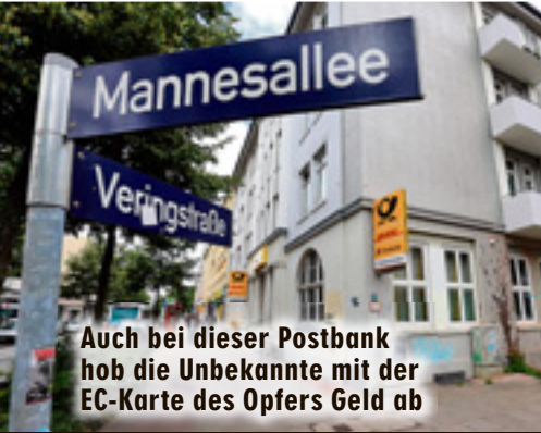
Auch bei dieser Postbank hob die Unbekannte mit der EC-Karte des Opfers Geld ab